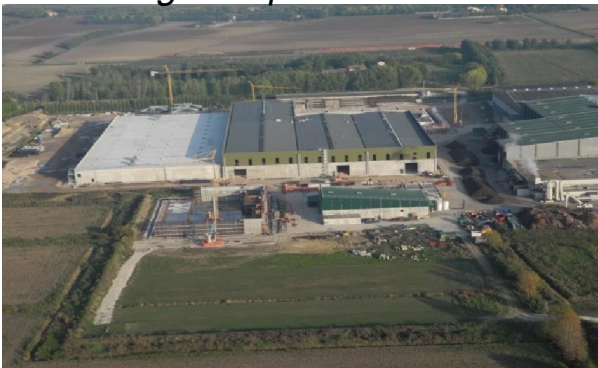
(1) Foto aerea dell'impianto di depurazione e compostaggio ad Este INDUSTRIALE

Società specializzata nel settore edile, ha un'esperienza costruttiva manageriale e imprenditoriale sviluppata da più di cinquant'anni, a cavallo di due generazioni, ed è in continuo grow up.