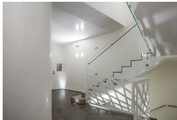
4) Ingresso di Palazzo San Martino a Padova - RISTRUTTURAZIONE

(Da sempre, riconosciuta come azienda leader, è in grado di far fronte alla costruzione di opere rilevanti quali edifici industriali, civili e commerciali, abitazioni e ville residenziali, ristrutturazioni di pregio, impianti di depurazione, ed è sempre aperta a nuove prospettive.