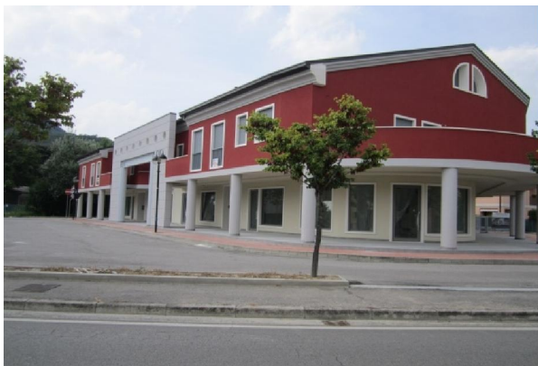
(2) Palazzina commerciale residenziale a Baone (PD) - COMMERCIALE